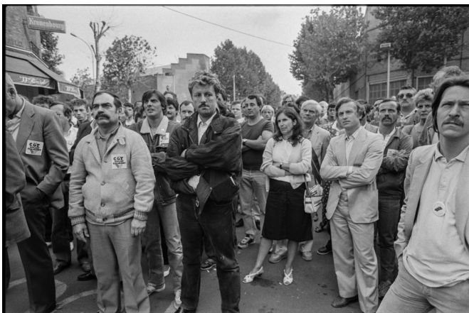
Des ouvriers de la Régie Renault de Boulogne-Billancourt manifestent le 8 août 1986 devant le siège de l'entreprise contre les mesures de licenciement annoncées.