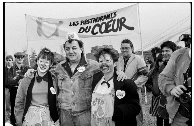
Coluche pose avec deux bénévoles devant l'entrée du Restaurant du Cœur à Gennevilliers pour l'inauguration d'un des trois Restaurants du Cœur de la région parisienne, le 21 décembre 1985.

Pour toute demande de photos, contactez l'AFP Communication@afp.com