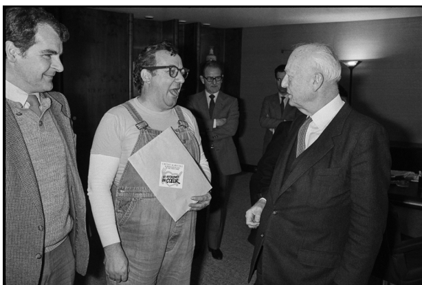
Le 20 février 1986, Coluche se rend au Parlement européen à Strasbourg pour plaider la cause des Restaurants du Cœur auprès notamment de Pierre Pflimlin, président du Parlement.

Théâtre National de Strasbourg 1 Avenue de la Marseillaise 67000 Strasbourg