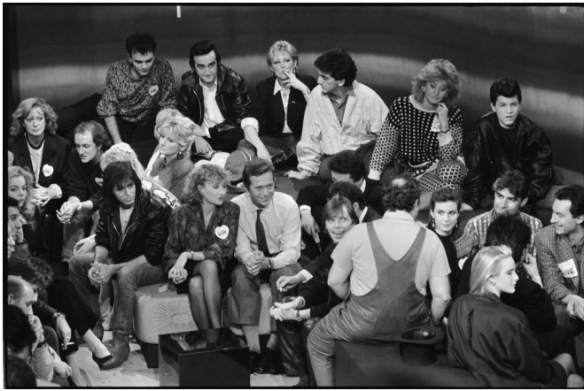
De nombreuses personnalités participent à l'émission télévisée de TF1 pour les Restaurants du Cœur organisée par son fondateur Coluche (de dos), à Paris le 26 janvier 1986.

En 1985, Jean-Marie Lotz épaulé par une bande d'étudiants de l'Ecole de Commerce de Strasbourg, assure au nom des Restos du Cœur et avec très peu de moyens la première distribution de produits alimentaires à des personnes démunies. A l'époque, le local est prêté par la ville de Strasbourg et l'approvisionnement constitué d'invendus collectés sur les marchés et auprès de commerçants solidaires. Quarante ans plus tard, l'association des Restos du Cœur du Bas-Rhin distribue chaque semaine 47 860 repas à 19 360 personnes accueillies dans 16 centres, et plus de 1 200 repas chauds au sein d'un pôle dédié aux des Gens de la Rue, grâce à 800 bénévoles.